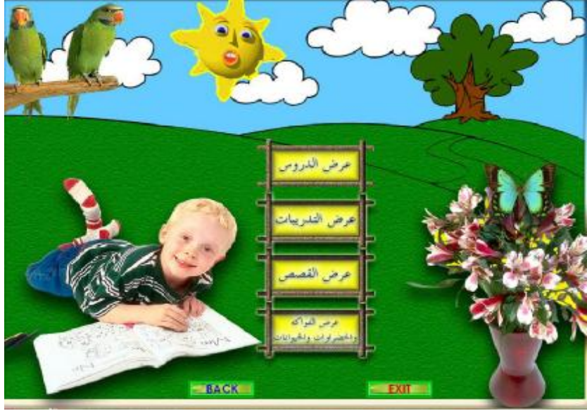
الشاشة (2) واجهة برنامج تعليم القراءة