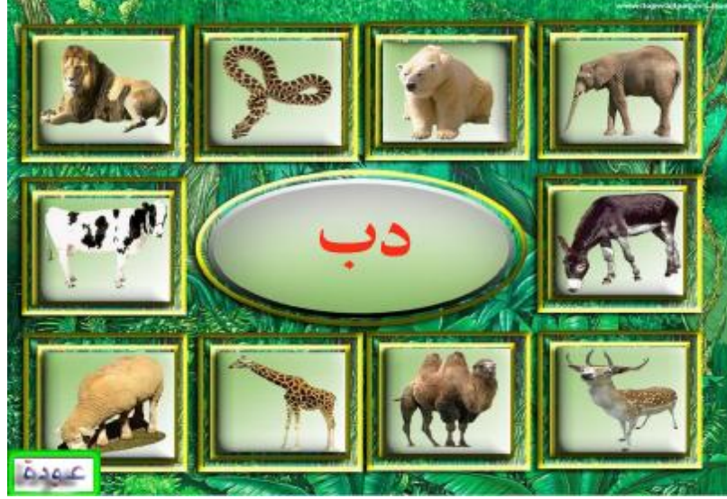
الشاشة (4) واجهة برنامج تعليم العلوم