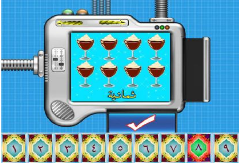
الشاشة (3) واجهة برنامج تعليم الرياضيات