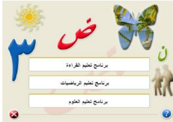
الشاشة (1) الواجهة الرئيسية للبرنامج